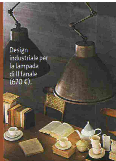
Design industriale per la lampada di Il fanale (670 €).