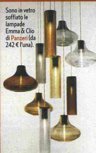
Sono in vetro soffiato le lampade Emma & Clio di Panzeri (da 242 € l'una).

IN CASA LE LUCI SI RINNOVANO: I LAMPADARI MESCOLANO FORME E COLORI, MENTRE I CLASSICI DA TAVOLO SI VESTONO DI METALLI SCINTILLANTI