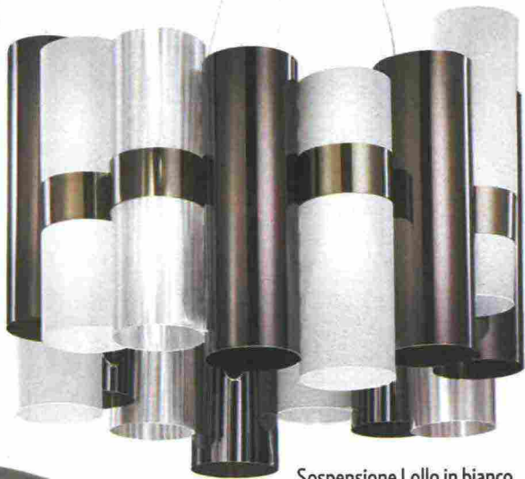
Sospensione Lollo in bianco e oro nero di Slamp (495 €).